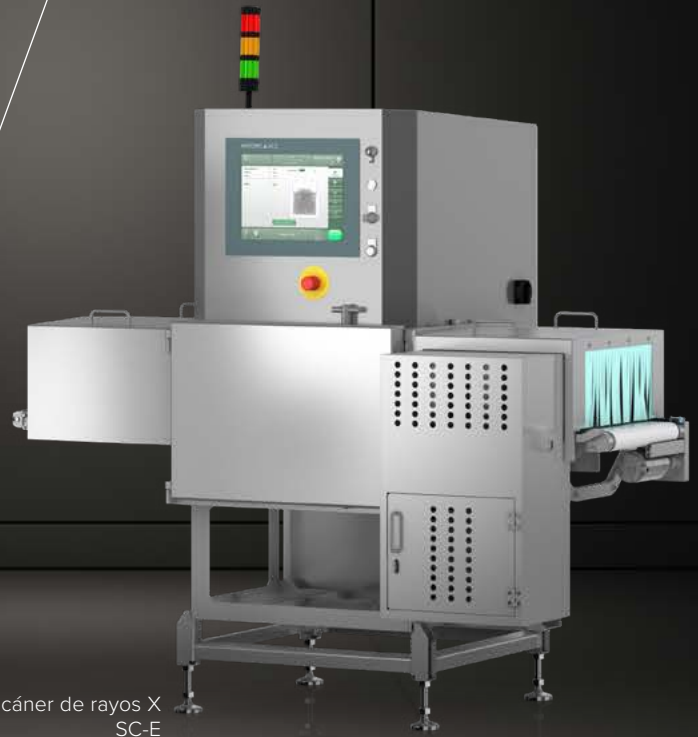
Escáner de rayos X SC-E

WIPOTEC OCS WEIGHING AND INSPECTION SOLUTIONS