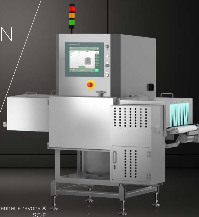
Scanner à rayons X SC-E

WIPOTEC OCS WEIGHING AND INSPECTION SOLUTIONS