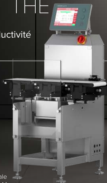
Trieuse pondérale HC-M